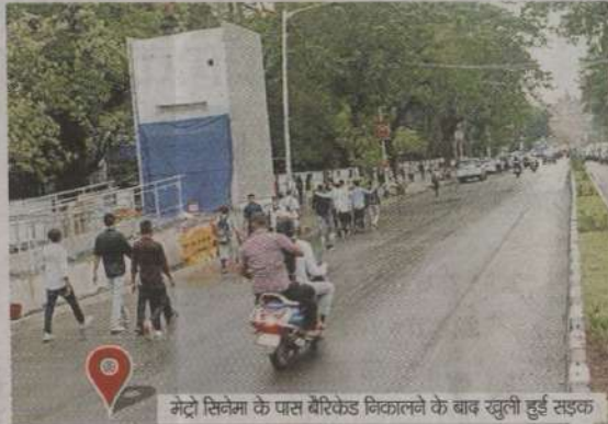
मेट्रो सिनेमा के पास बैरिकेड निकालने के बाद खुली हुई सड़क

अंडरग्राउंड मेट्रो-3 परियोजना के काम के चलते शहर के कई इलाकों को पिछले 8 साल से बैरिकेड लगाकर बंद किया गया है। अब जैसे-जैसे परियोजना का काम पूरा हो रहा है, धीरे-धीरे बैरिकेड हटाने का काम शुरू हो गया है। हाल ही में मुंबई मेट्रो रेल कारपोरेशन (एमएमआरसीएल) ने दक्षिण मुंबई में अंडरग्राउंड मेट्रो-3 के रूट पर लगाए गए 4401 बैरिकेड को हटा दिया है। इससे दक्षिण मुंबई के 4 किमी से ज्यादा हिस्से में यातायात सुगम हो गया है। जिन इलाकों में ये बैरिकेड लगाए गए थे, वह रिहायशी इलाके हैं। यहां बैरिकेड हटाने से स्थानीय लोगों ने राहत की सांस ली है। मेट्रो परियोजना के पैकेज-1 में कफ परेड, विधान भवन, चर्चगेट और हुतात्मा चौक को कवर करने वाली 3,236 मीटर सड़क का 81 प्रतिशत हिस्सा बैरिकेड हटाकर बहाल कर दिया गया है। जबकि पैकेज-2 के 1,165 मीटर हिस्से से बैरिकेड हटाए गए हैं। इसमें सीएसएमटी, कालबादेवी, गिरगांव और ग्रांट रोड की 45 प्रतिशत सड़कें बैरिकेड से मुक्त हो गई हैं।